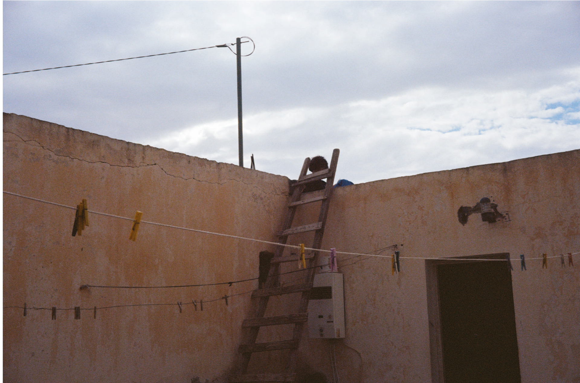
Sans titre, 2024, photographie, 13x18 cm