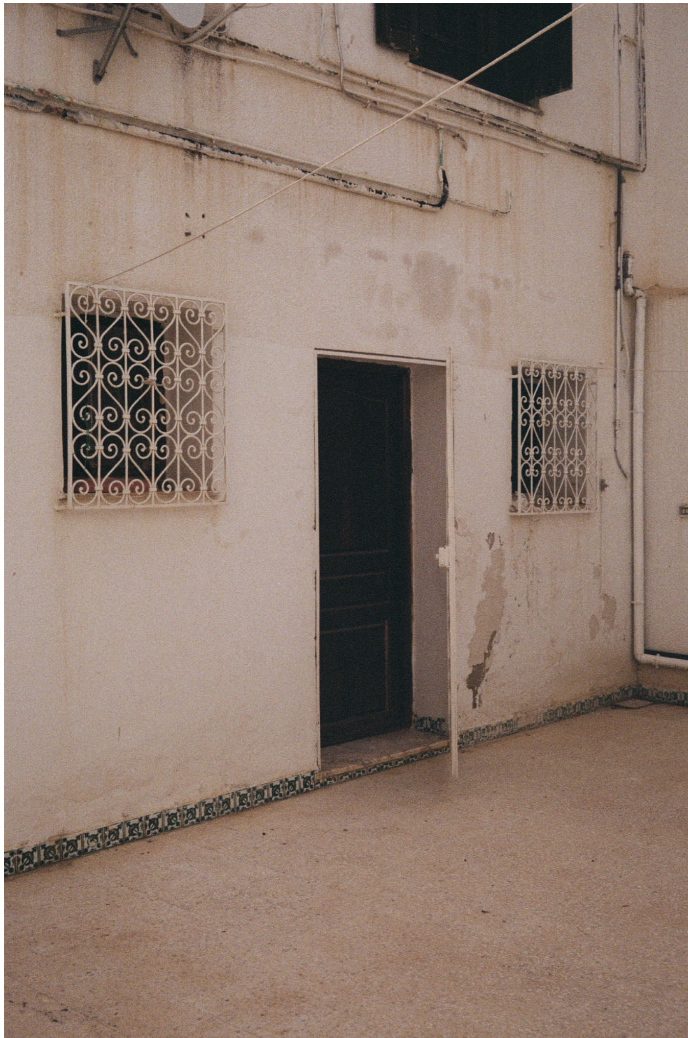
Sans titre , 2024, photographie, dimensions variables