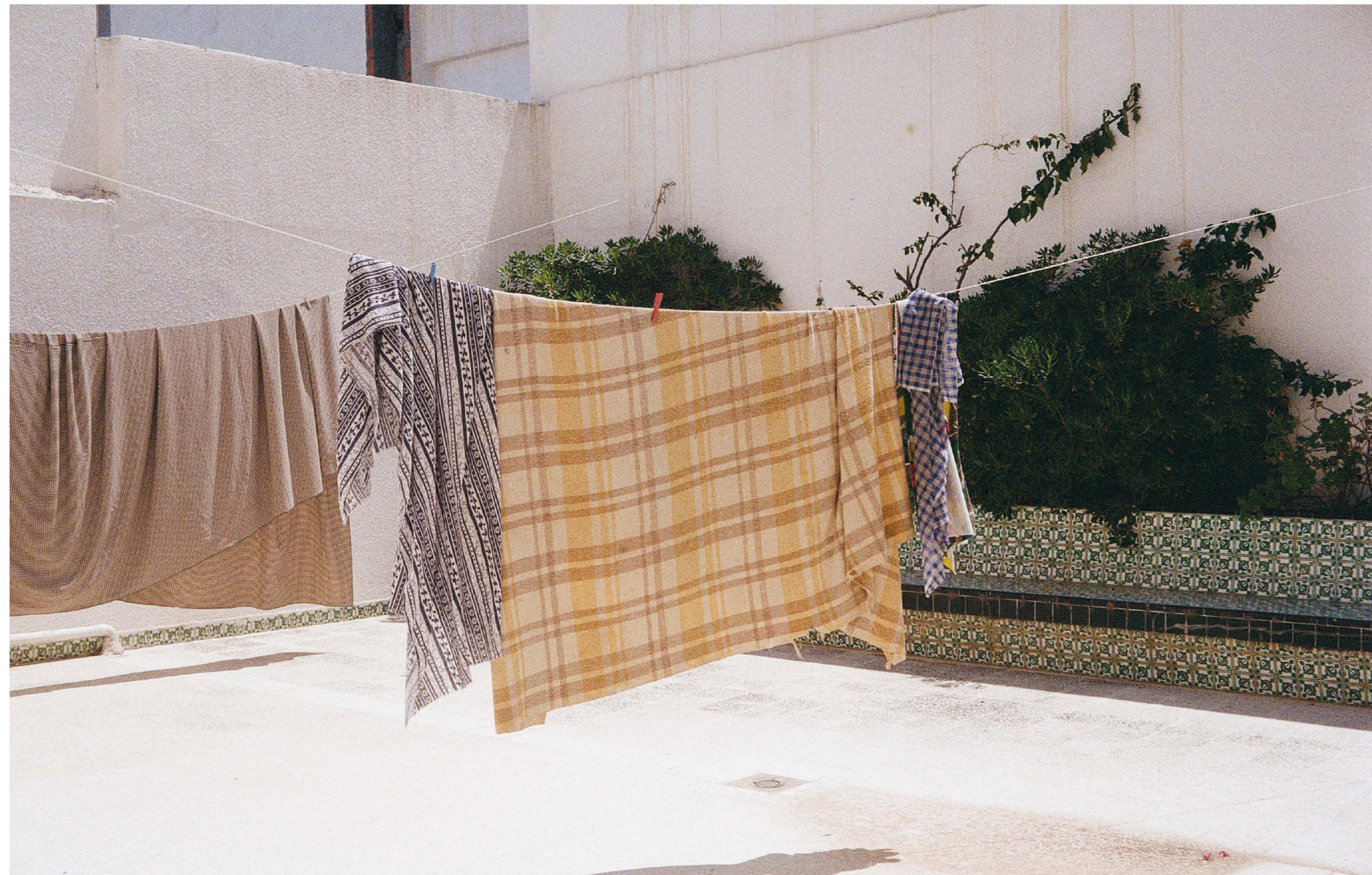
Sans titre , 2023, photographie, dimensions variables