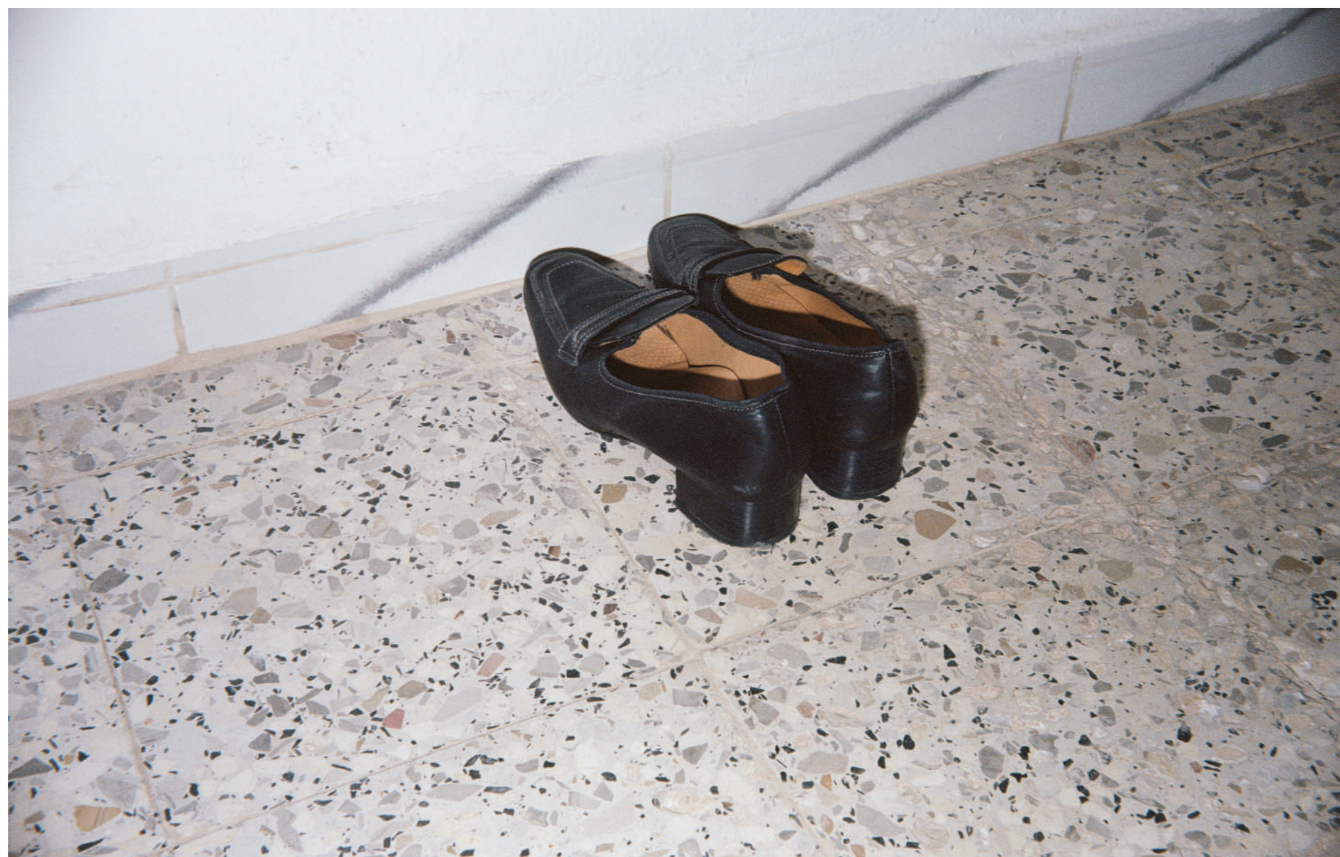
Les chaussures de ma grand-mère, 2024, photographie, 10x15 cm