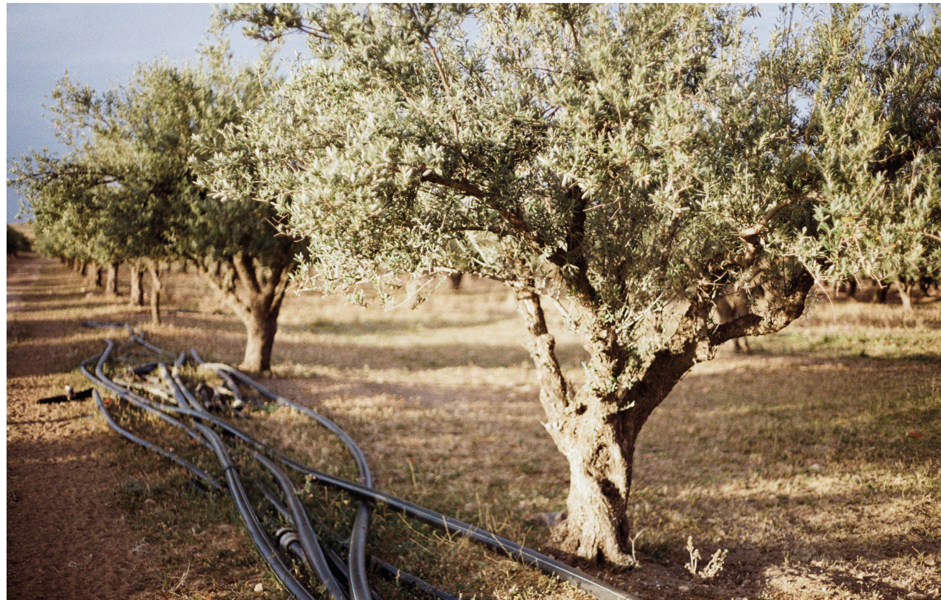
Sans titre , 2024, photographie, dimensions variables