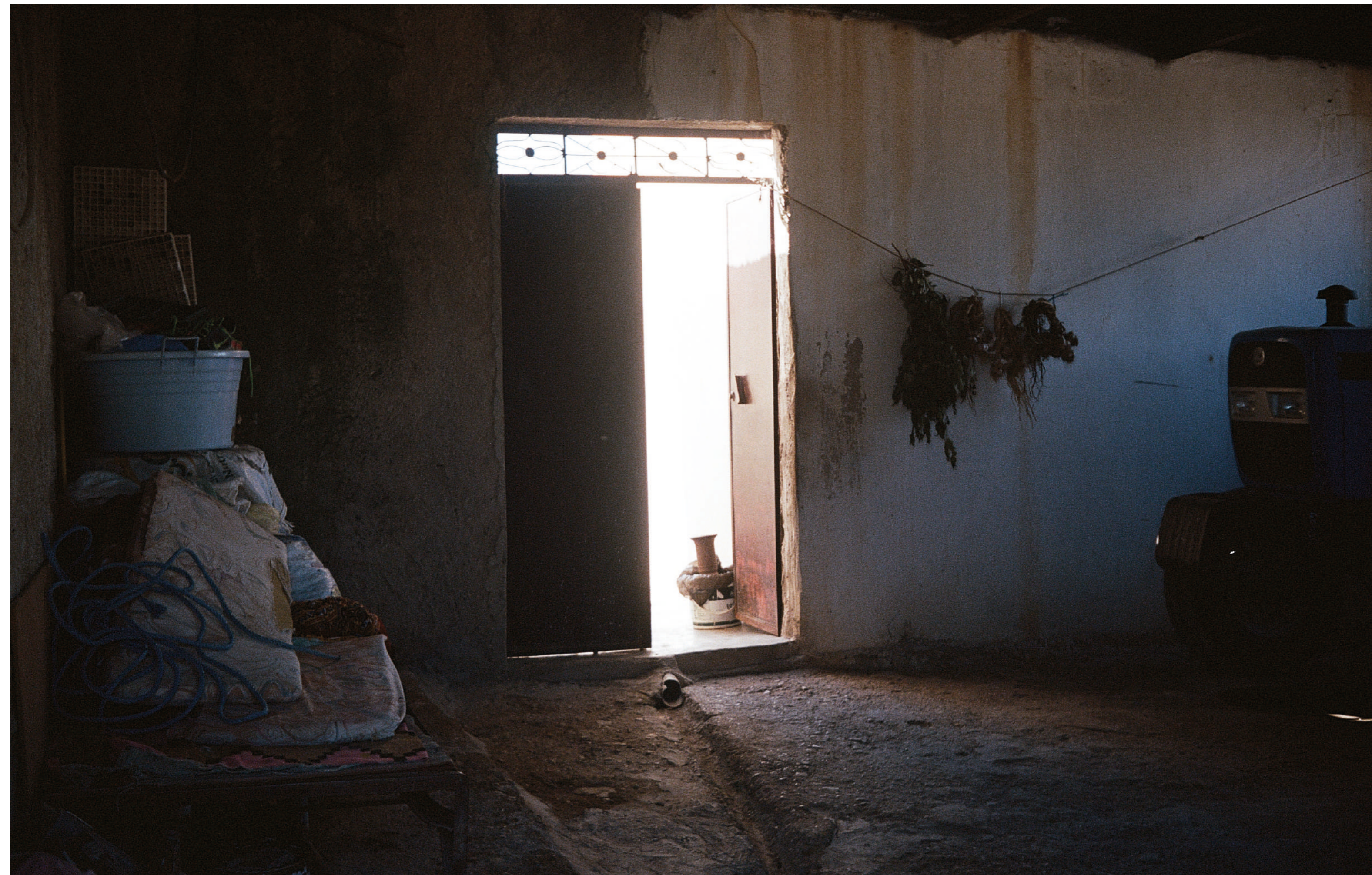
Sans titre , 2023, photographie, dimensions variables