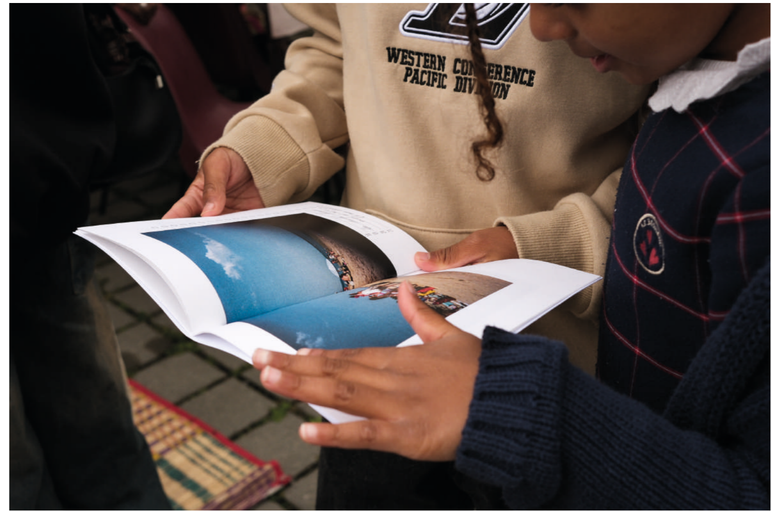
Les vacances c'est sauter plus haut que l'habitude, vues de la maquette lors de la restitution à la Fête de quartier