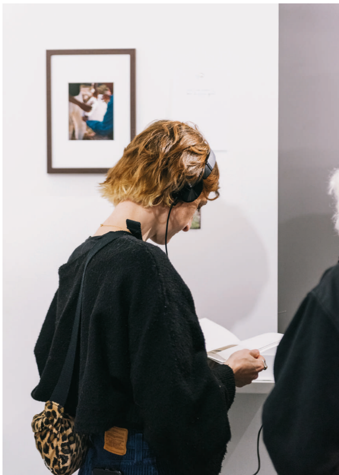
Ecouter sur Soundcloud