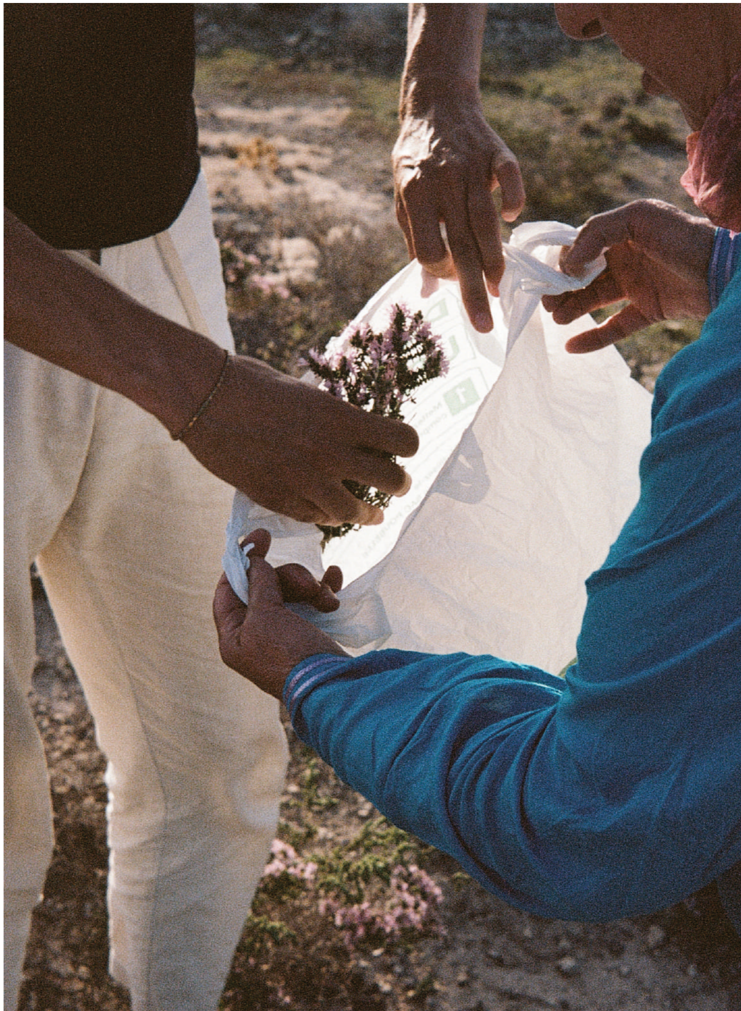
Mon frère et ma grand-mère cueillant le zaatar, 2023, photographie, 10x15 cm