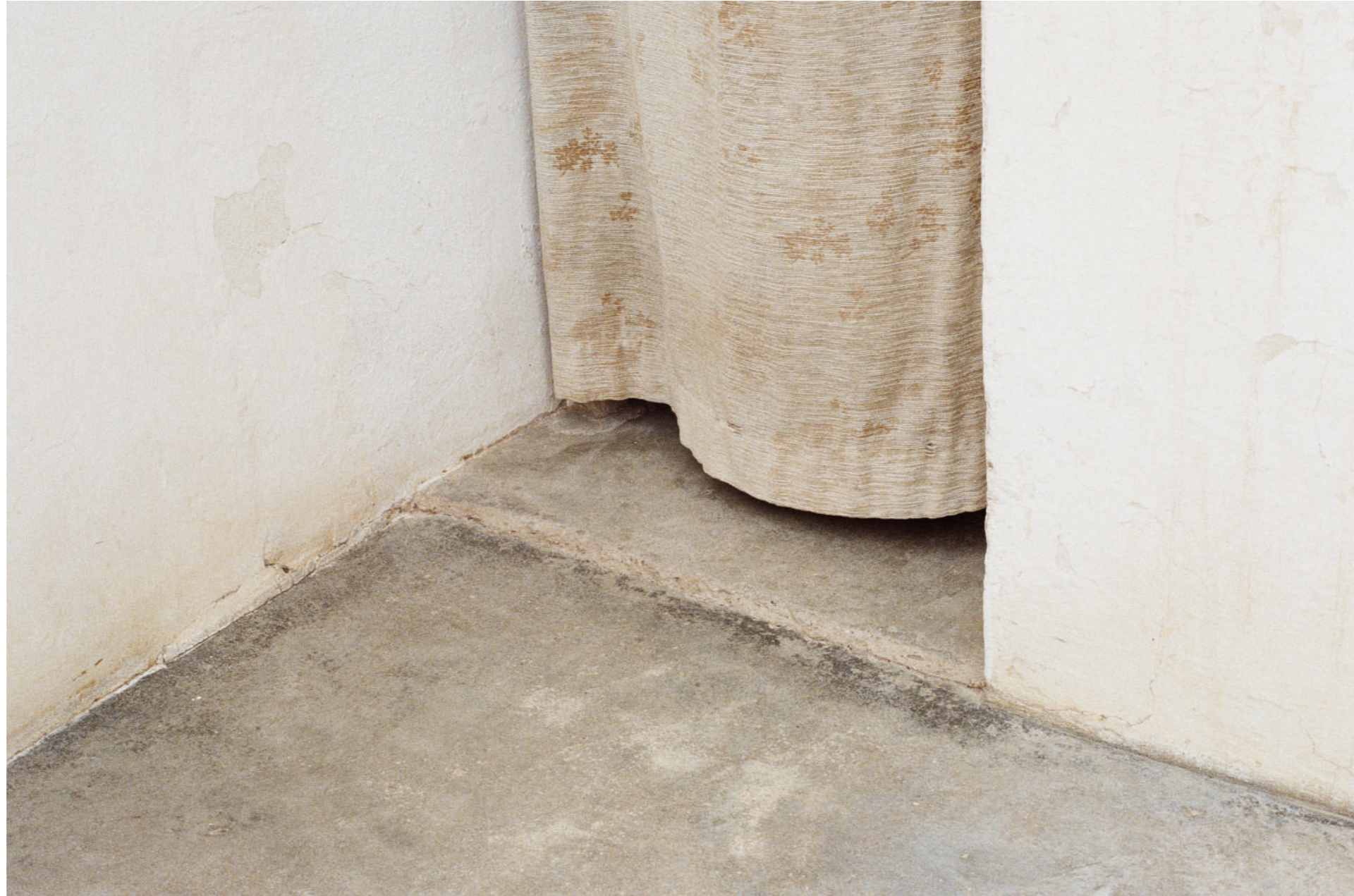
Sans titre , 2024, photographie, 13x18 cm